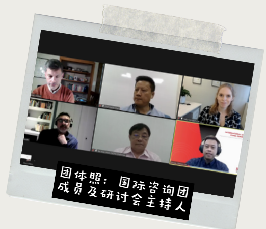
团体照：国际咨询团成员及研讨会主持人

3月16日至19日，国际咨询团成员与滨海湾金沙和圣淘沙名胜世界赌场，以及新加坡博彩公司，就负责任赌博措施进行了讨论。他们还会见了全国预防嗜赌理事会，并在为期两天的研讨会上发表演说。研讨会由社会及家庭发展部长马善高致开幕词，共有120余名来自博彩业、政府机构和社会服务领域的人士参与。