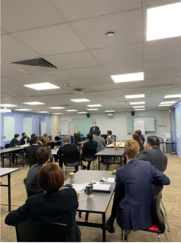
在采取安全管理措施之下 进行培训课程

赌场的负责任赌博大使（RGAs）加强版培训已于十月恢复。 培训的目的是为增进大使们的知识和沟通技巧， 以便与赌场访客进行有意义的交流。